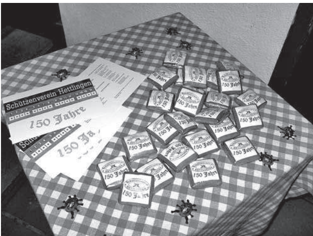
150 Jahre Tradition und Schiesssport

Der Anfang in unserem Jubiläumsjahr bildete der Neujahrsapéro in der Zelglitrotte. Hier konnten wir mit der Dorfbevölkerung und den Behörden gemeinsam auf das neue Jahr und auf unser Jubiläumsjahr anstossen. Dieser Auftakt war auch aus Sicht des Schützenvereins Hettlingen ein toller Erfolg. Hat sich doch bereits zu Jahresbeginn gezeigt, mit welcher Hilfsbereitschaft die Vereinsmitglieder anpacken können, eine gute Basis für die weiteren Aktivitäten im Jahr 2014.